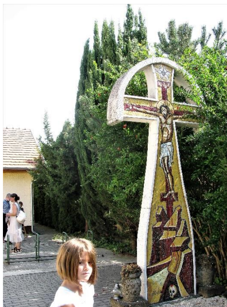
A templom udvarán