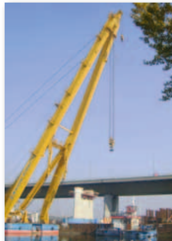
Felvonult a 200 tonna teherbírású, 50 méter magas Clark Ádám úszódaru is