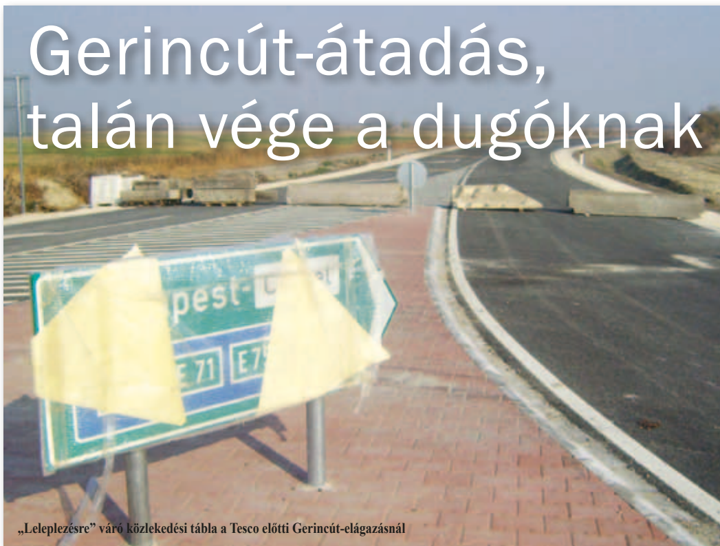
„Leleplezésre” város közlekedési tábla a Tesco előtti Gerincút-elágazásnál

Novemberben átadják a Gerincút első szakaszát a reptér melletti úttól a szigetszentmiklósi M0-ás csomópontig. Megindult a városi Duna-híd második pályatestjének az építése.