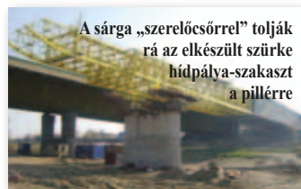
A sárga „szerelőcsőrrel” tolják rá az elkészült szürke hídpálya-szakaszt a pillérre