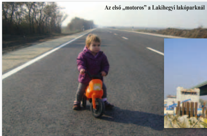
Az első „motoros” a Lakihegyi lakóparknál

Holakovszky László (A szerző felvételei)