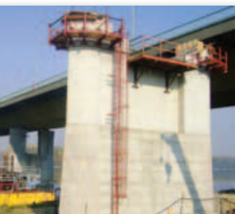
Egy elkészült ártéri pillér a szigeti oldalon

Nekünk viszont megmaradt (hacsak a reptér be nem indul) a csendes, tiszta levegőjű Halásztelek. Kérdés, melyikkel járunk jobban.