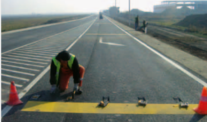
Az utolsó simítások a Petőfi úti kereszteződésnél