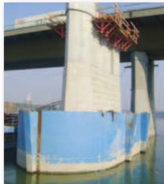
A vaslemez őrfallal körülvevett mederpillér

A „tolás” során nyolcszáz tonnát kell mozgatni, számítógéppel vezérelt óriási teljesítményű hidraulikával. Síneken, görgőkön másodpercenként